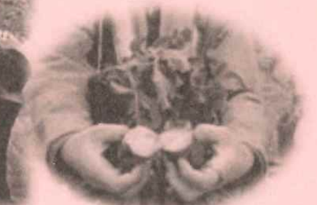
えんの庭での焼き芋風景