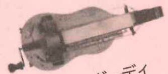
ハーディガーディ