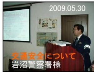
2009.05.30 交通安全について 岩沼警察署様