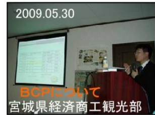
2009.05.30 BCPについて 宮城県経済商工観光部