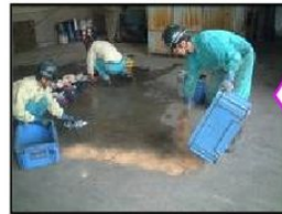
漏洩報告有 り応援要請