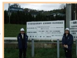
処理施設・カンパンの確認

廃棄物を排出する企業の責任として、弊社でもリサイクル出来ない残渣物については処理業者を定期的にチェックしております。今年度は運送業者の確認も行いました。