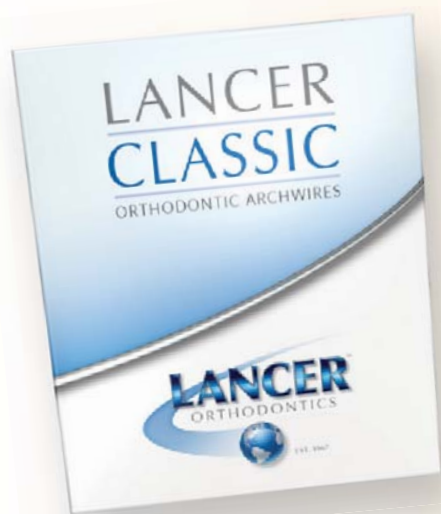
LANCER CLASSIC COATED