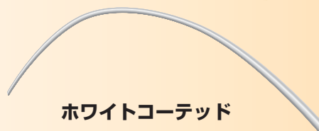
ホワイトコーテッド