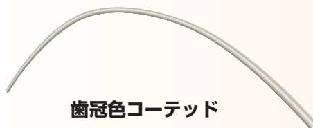
歯冠色コーテッド