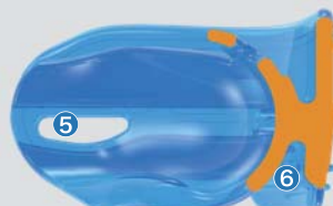
MYOSA® FOR KIDS 装置-断面図