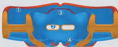
MYOSA® FOR KIDS 装置