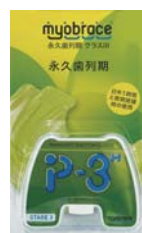
P-3H (中硬度ポリウレタン)