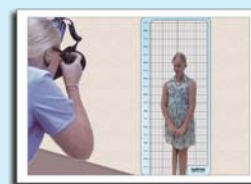
レギュラーサイズ(1980×900) スモールサイズ(1800×700)