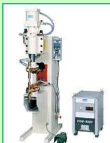
直流インバータ式 スポット溶接機