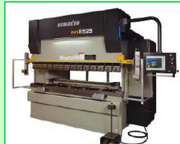
油圧・サーボドライブプレスブレーキ PVS8525NET