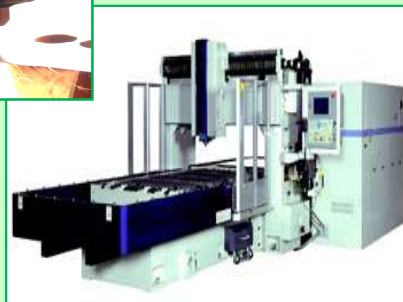
2次元レーザー加工機 HV-20CF2