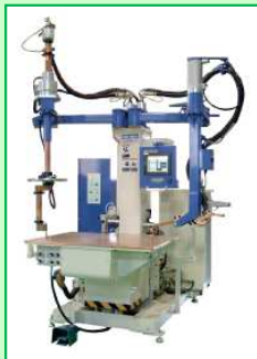
テーブルスポット機