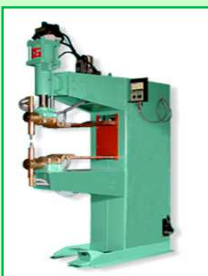
プロジェクション 溶接機