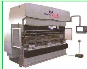
ACサーボドライブプレスブレーキ PAS8025NET