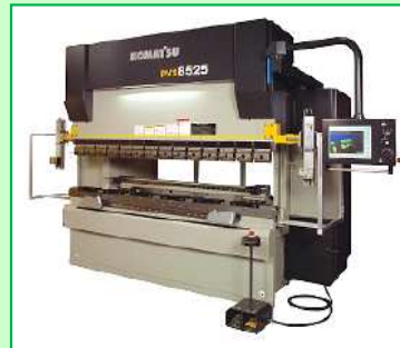
油圧・サーボドライブプレスブレーキ PVS8525NET