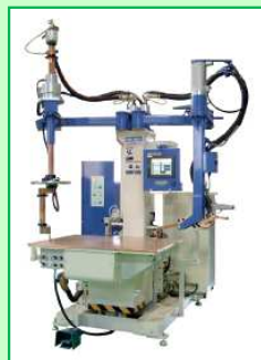
テーブルスポット機 NK-21HEV810-M-KG-EZ