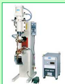
直流インバータ式 スポット溶接機