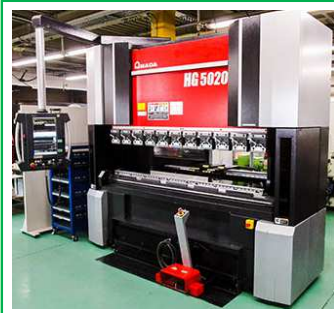
ACサーボモータープレスブレーキ HG5020