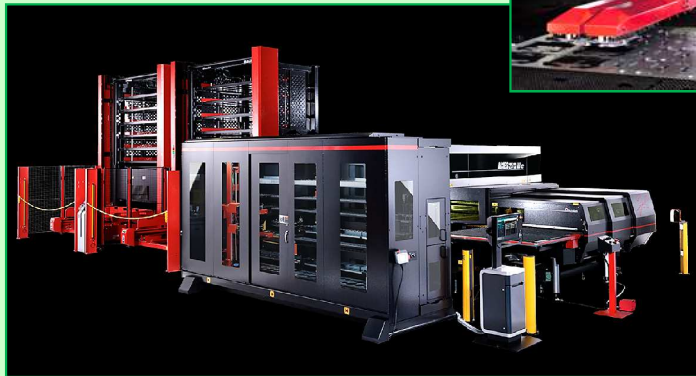
タレパン・レーザー複合機 ACIES12TAJE