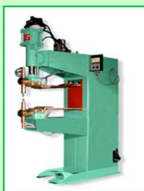
プロジェクション 溶接機