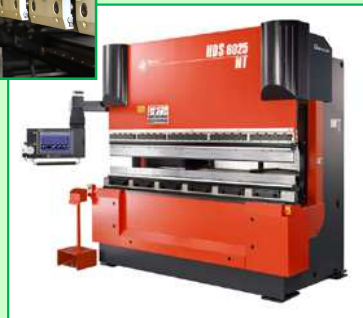
ACサーボモータープレスブレーキ HDS8025NT