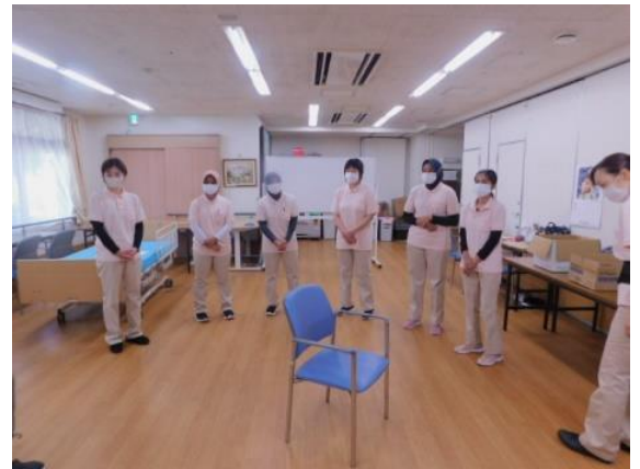
日本人スタッフも一緒に新人研修