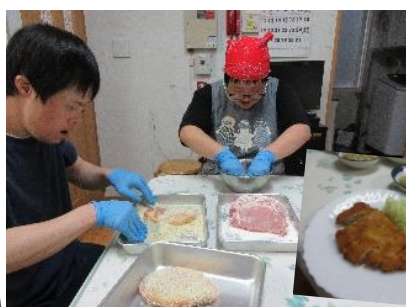
第2のとんかつ作り