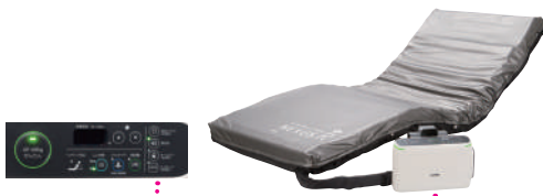
エアマスターネクサスRセット