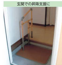
玄関での昇降支援に

⚠ 予測できない行動をとられる利用者(認知症など)や、自力で危険な状態から回避できない利用者につきましては、使用をお控えください。