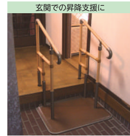
玄関での昇降支援に

⚠ 予測できない行動をとられる利用者(認知症など)や、自力で危険な状態から回避できない利用者につきましては、使用をお控えください。