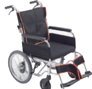
ケアフィットプラス(介助)