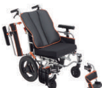
ケアフィットウイング(介助)