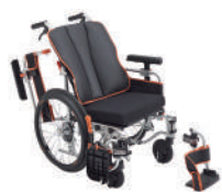
ケアフィットウイング(自走)