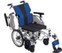
イージーフィット(介助)