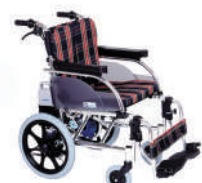
ハイパワー型アシストホイール