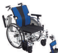
イージーフィット(自走)