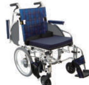
ケアアジャスト(介助)