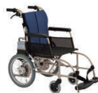
アシストホイールライト