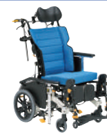
マイチルト・ミニ3D