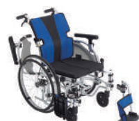
イージーフィット(自走)