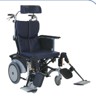
オアシスポジティブ