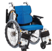
ネクストコア・マルチ(自走)