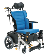
マイチルト・ミニ3D