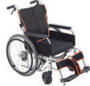
ケアフィットプラス