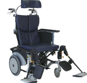
オアシスポジティブ