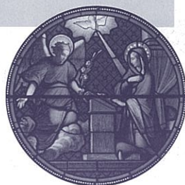
受胎告知 (トゥールのロノエ工房)