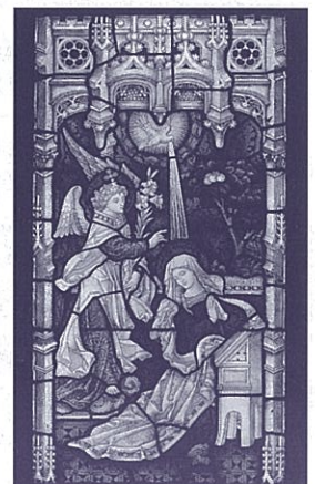
受胎告知 (クレイトン&ベル工房)