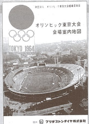
オリンピック東京大会会場案内地図(焼津市歴史民俗資料館蔵)

1964年東京オリンピックが開催された頃、人々の生活を豊かにした最新家電やその広告デザイン資料、めざましく発展してゆく昭和の社会を表現した絵画作品を紹介。ちょっと昔の暮らしとアートデザインを展示します。