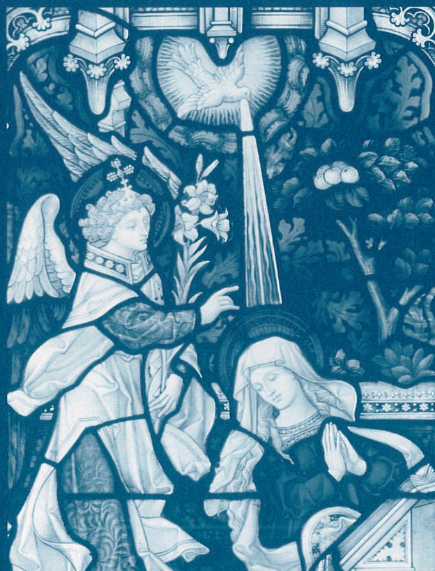
《「受胎告知」クレイトン&ベル工房》