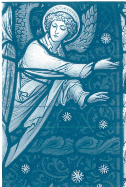
《エジプトへの避難(部分)》