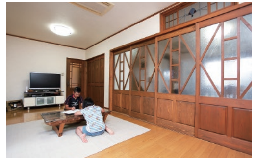
リビングではお子様たちが夏休みの宿題をされていました