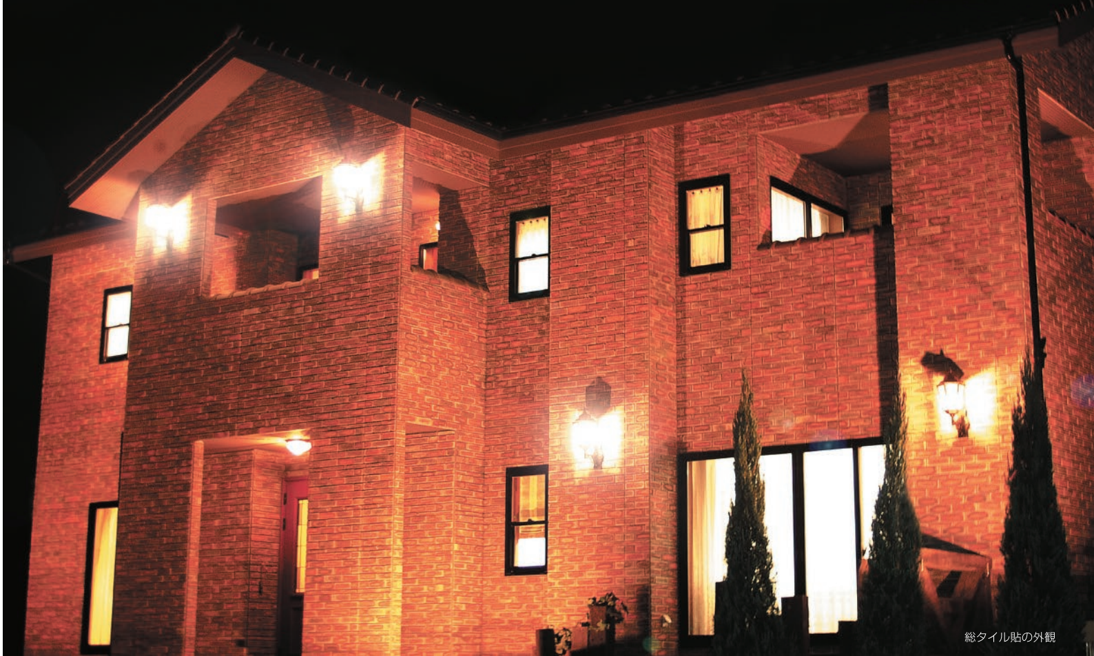
総タイル貼の外観