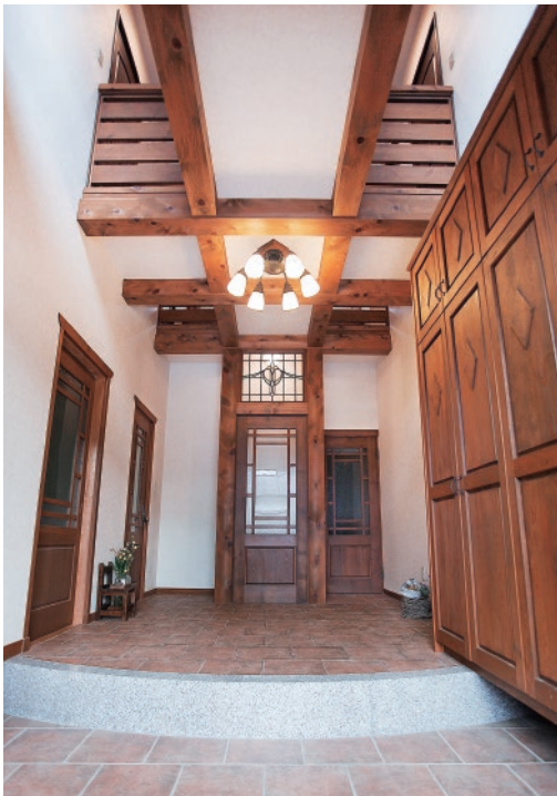
威風堂々とした玄関エントランス

※高知産の天然桧を使用しましたが、これほどのものは今ではほとんど手に入らなくなりました。