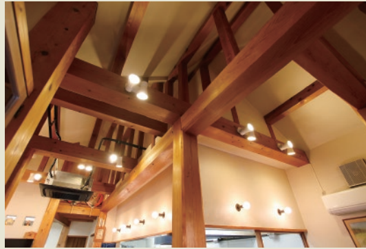
太い柱、梁は現在も力強く店を支えている