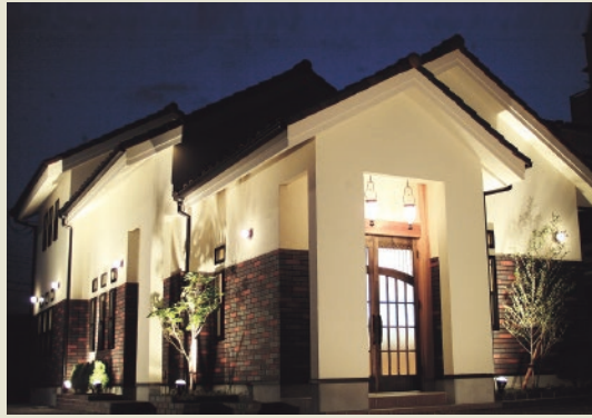
完成時のらーめん亭