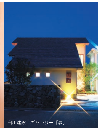
白川建設 ギャラリー「夢」