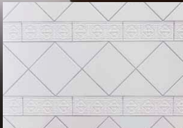
水まわりにはインポートもののタイルを採用。三角形に割ったものを組み合わせることでより個性的なデザインに仕上げている。