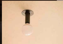
無垢の木と漆喰が美しい和室には、あえて銅製のレトロな照明をコーディネート。モダンなインテリアとの相性も良い。