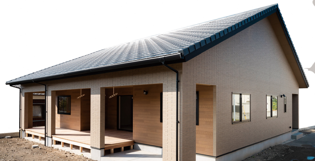
新居浜市萩生 K様邸

ベージュを基本としながらも、ブラウンに張り分けることで、場所によって見た目が変わり、一味違った印象をもたせることができる外観に仕上がりました。また屋根の高さを2階建住宅とほぼ同じにしたことで、広いLDKの吹き抜けを更に高く取ることができ、大空間を誕生させました。それにより職人によって加工された木組みの美しさがよりいっそう目を引きまします。ご友人の多いお施主様のご希望で、南面には約15畳の広いウッドデッキを設けました。屋根があることで使い勝手の良いスペースとなっており、この住宅の数多い見所の中の1つです。白川建設では、造作棚やニッチ、収納内部の仕様などは住宅が完成してきて、お施主様がしっかりとイメージできるようになってから、打ち合わせを繰り返し行い決定していきます。白川建設だからこそのきた、満足度の高い遊び心のある住宅です。