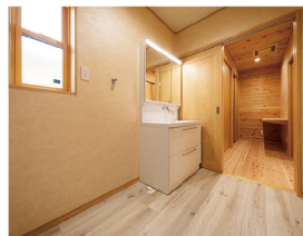
多用途洗面脱衣室