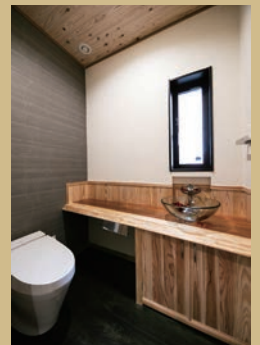
トイレには、奥さまがネットで探してきた手洗いボウルを設置。 造作台には防水加工を施している。