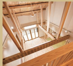
造作本棚を造ったロフトスペースは、 親子でゲームを楽しめるような空間に。