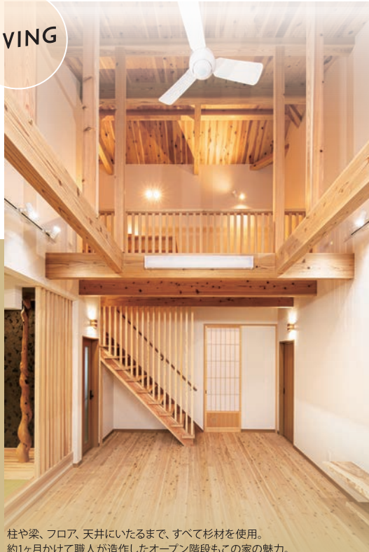
柱や梁、フロア、天井にいたるまで、すべて杉材を使用。 約1ヶ月かけて職人が造作したオープン階段もこの家の魅力。