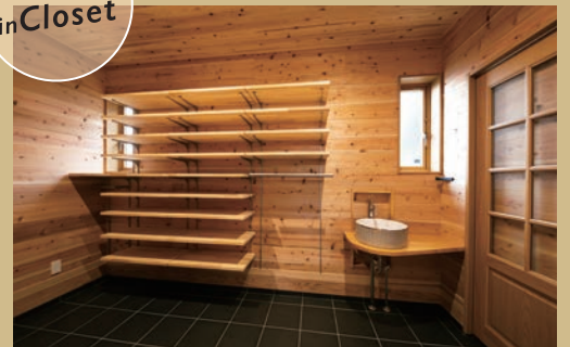
広々としたシューズクローゼットには手洗い場を設けた。 遊び盛りのお子さんのお着替えも考慮。