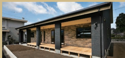
12mもあるウッドデッキは、友人とのBBQや子どもと遊ぶのにうってつけ。