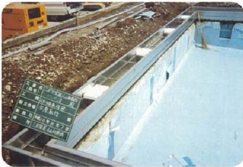
ステンレス製集合導管設置 FRP ライニング：床面 側面