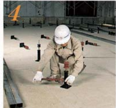
4 支持台に調整ボルト等をセットし、アンカーボルトに支持脚をネジ込む。