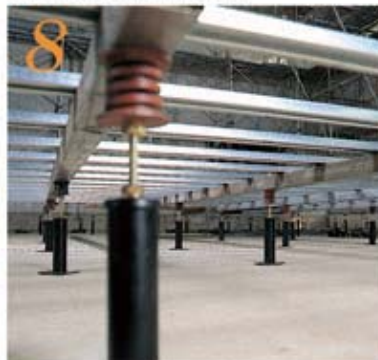
8 下地組取付け完了後、次工程に入る前に性能を損なわないよう養生する。