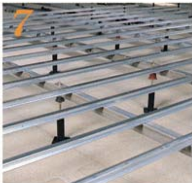
7 根太を取付け完了後、点検・検査を行なう。