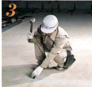
3 ハンマードリルで穴開け加工した穴にアンカーボルトを打ち込む。