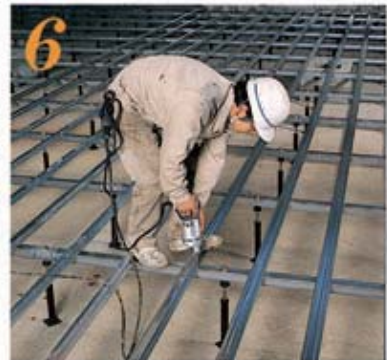
6 大引上に根太をタップ・タイトビスにて完全締付けする。