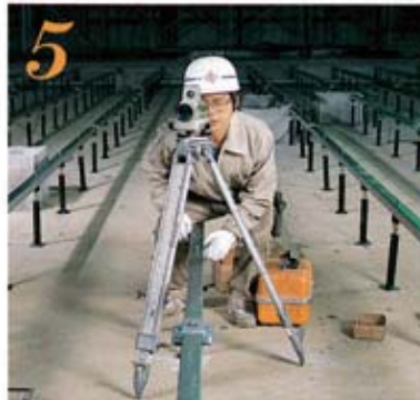
5 水平器を用い、レベル調整を行ないながら、大引を完全締付け固定する。