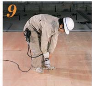
9 根太取付け後、捨張材を取付け、ドライウォールスクリーで固定する。