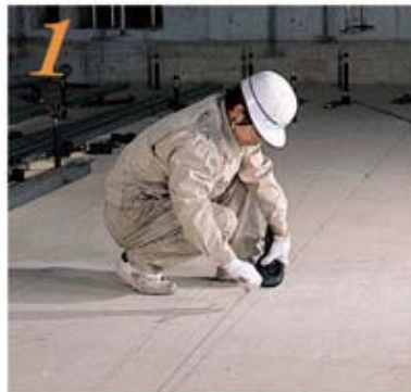
1 あらかじめ、きれいに清掃した、床スラブに施工図に基づき所定の間隔により墨出しを行なう。