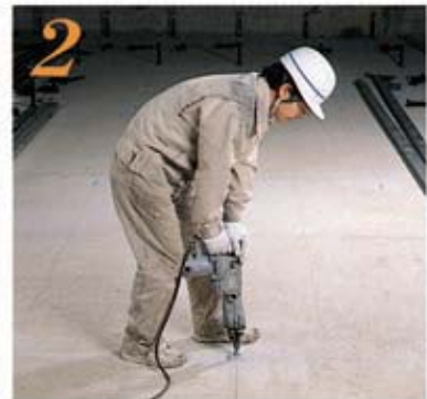
2 墨出し後、基準墨に従ってハンマードリルで12.7φの穴開け作業を行なう。