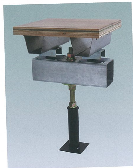
ジム・エース・スーパーG5000形 (5トン用) (大引の仕様については、支持脚のピッチと 荷重条件によって設定して下さい)