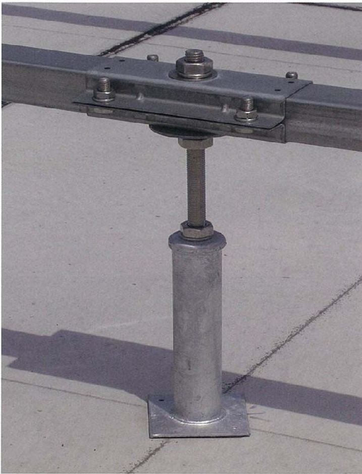
写真は太引ジョイント部です