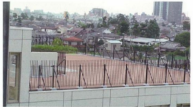
(千葉県某私立学校)