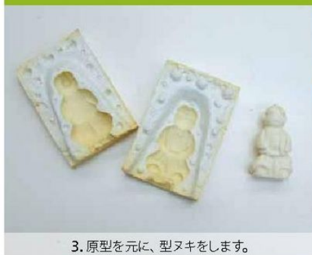
3. 原型を元に、型抜きをします。