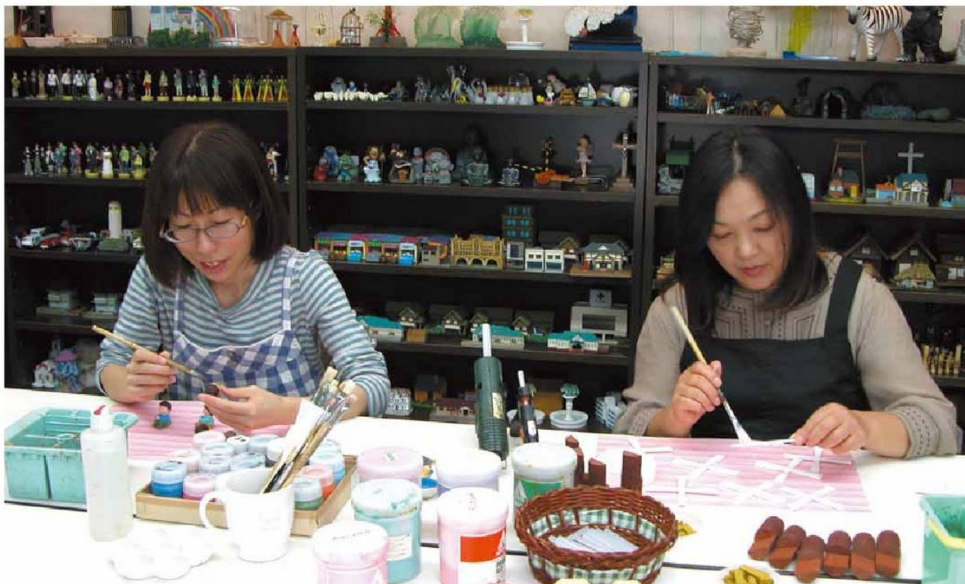
メルコム工房の現場です。見学もできます。