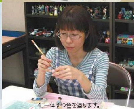
4. 一つずつ色を塗ります。