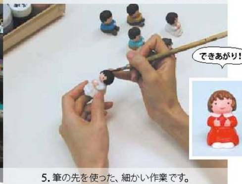
5. 筆の先を使った、細かい作業です。