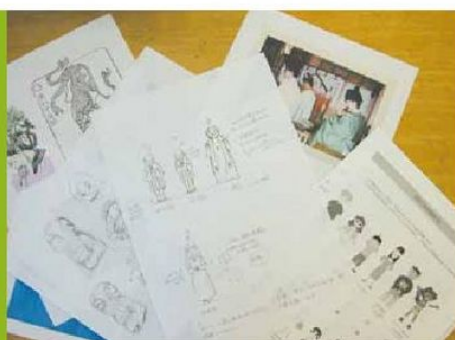
1. 現場の声を取材して企画を立てます。

メルコムの人形は、そのほとんどが手作り。ここでは、人形の製作過程をご紹介します。実際には、さらに細かい作業を経て完成します。