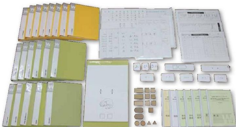
Wプログラム訓練キット

また、基本音節のチェックリスト、特殊音節の形成テスト(促音、長音、拗音、拗長音(全特殊音節))が用意されていますので、訓練をしながら、習得レベルを知ることができます。