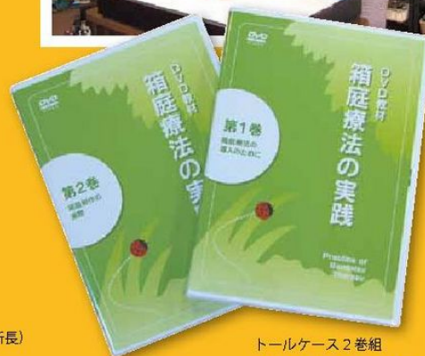
トールケース 2巻組 寸法 / 191 × 135 × 15mm