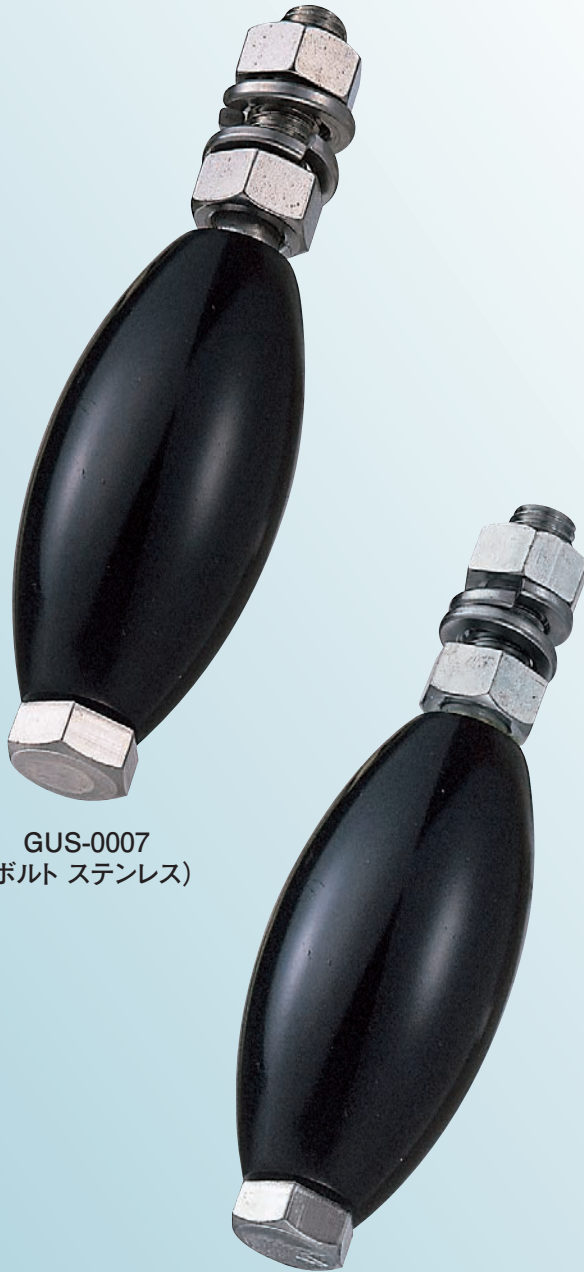
GUS-0007 (ボルト ステンレス)