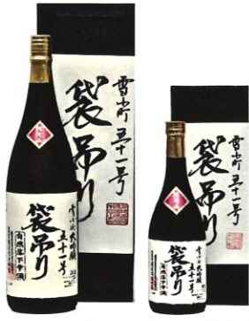
雪小町大吟醸 51号袋吊り 1.8L-8000円 720ml-4000円