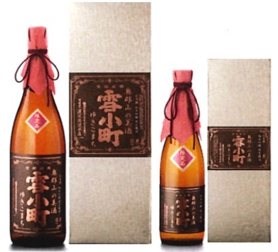
雪小町奥郡山の美酒純米吟醸 1.8L-6000円 720ml-3000円