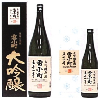
大吟醸 雪小町 51号 特黒 1.8-5000円 720-2500円 300-990円

雪小町(ゆきこまち)・・・北国の「雪」と、美酒=美人の「小町」で命名。北国の美酒に相応しいよう、また、東北福島の美味しいお酒であるよう、祈りが込められた銘柄です。