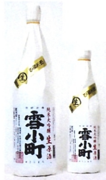
雪小町純大吟生原酒 1.8L-4000円 720ml-2000円