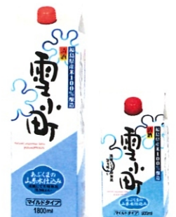
マイルドパック雪小町 1800ml-1800円 900ml-900円