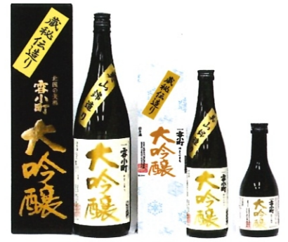
雪小町 大吟醸 50 1.8L-4000円 720ml-2000円 300ml-770円