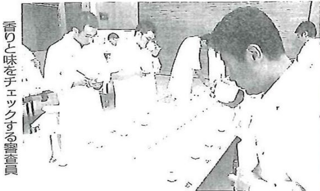
香りと味をチェックする審査員