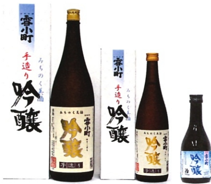
雪小町手造り吟醸・吟醸冷酒 1.8L-3000円 720ml-1500円 300ml-550円