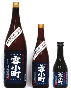
雪小町 純米酒 1.8L-2860円 720ml-1430円 300ml-660円