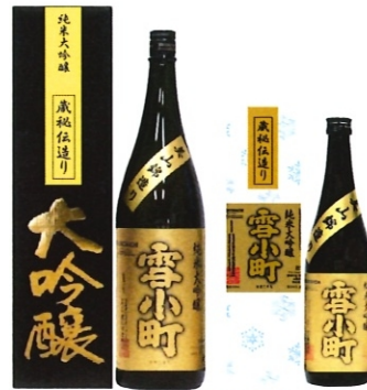
雪小町 純米大吟醸 50 1.8L-4000円 720ml-2000円