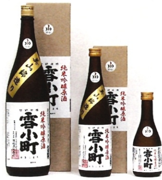
雪小町純米吟醸原酒 1.8L-4000円 720ml-2000円 300ml-770円