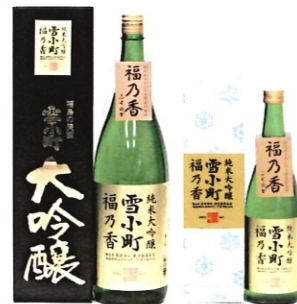
純米大吟醸 雪小町 福乃香 1.8-4000円 720-2000円 300-770円