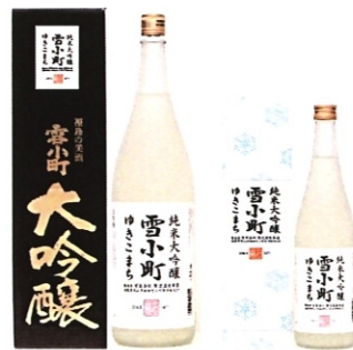
純米大吟醸 雪小町 特白 1.8-5000円 720-2500円 300-990円