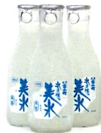
氷の酒 美氷 300ml-770円 300ml×6-5500円 (送料込み蔵元直送)