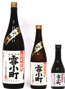
雪小町 純米吟醸 60 1.8L-3000円 720ml-1500円 300ml-660円