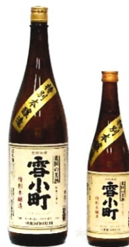
雪小町特別本醸造 1.8L-2800円 720ml-1400円