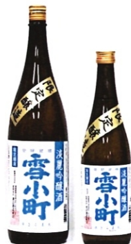
雪小町淡麗吟醸酒 1.8L-2800円 720ml-1400円 300ml-550円