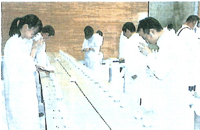
味や香りをチェックする鑑評会の審査員

県酒造組合の県秋季鑑評会は十一日、会津若松市の県ハイテクプラザ会津若松技術支援センターで開かれ、最高賞の知事賞に吟醸酒の部は雪小町(渡辺酒造本店・郡山市)、純