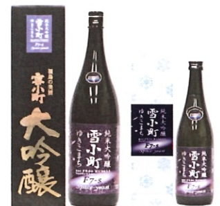
純米大吟醸 雪小町 F7-S 1.8-4000円 720-2000円 300-770円