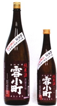
雪小町 純米 淡麗美味 1.8L-2860円 720ml-1430円