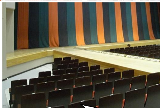
浅草公会堂外観と歌舞伎公演時の客席です。