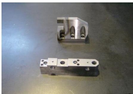
ブラケット S50C 焼入れ