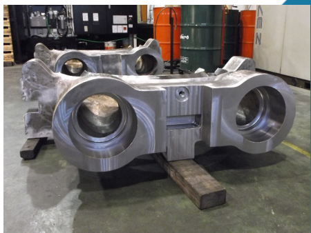
ノズル室 高温・高圧鋳鋼