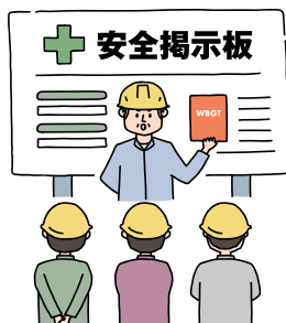
【朝礼やミーティングでの周知】