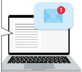
【メールやイントラネットでの通知】

皆様お疲れ様です。 本日のWBGT基準値は0°Cです。 作業時には充分に気をつけて、 水分補給及び休憩をしっかりと お願いします。 体調不良者が発生した場合は、 フロー図に基づき対応いただき、 〇〇さん(000-0000-0000)へ 連絡するようお願いいたします。 それでは本日もよろしくお願 いいたします。