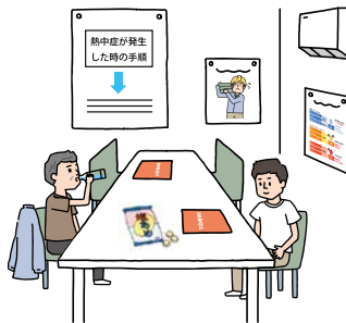
【会議室や休憩所などわかりやすい場所への掲示】