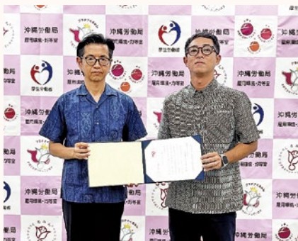
▲琉球セメント(株)様を囲んで

「くるみん」とは「子育てサポート企業」として、厚生労働大臣の認定を受けた証です。