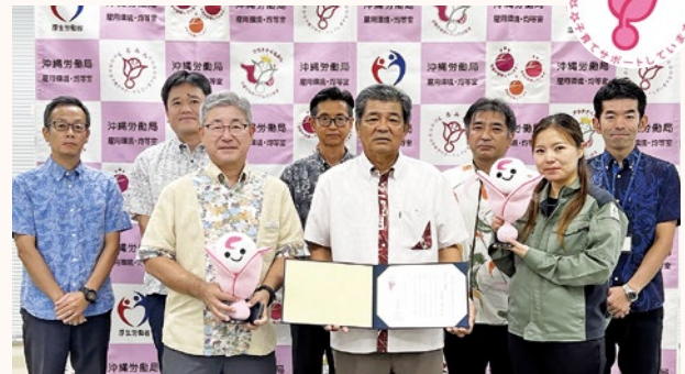
▲(株)那覇電工様を囲んで