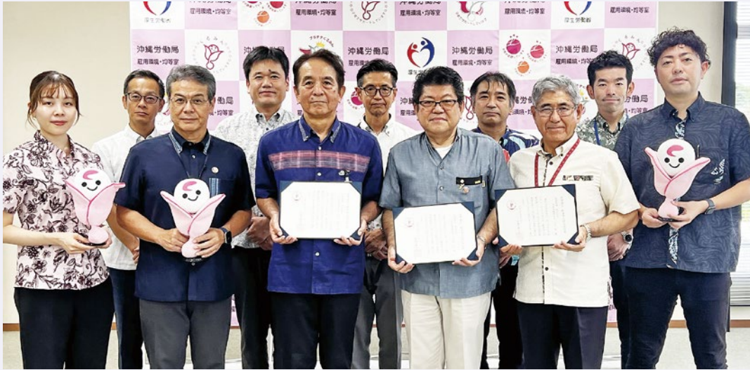
▲認定された「くるみんプラス」認定の拓南本社(株)様・拓南製鐵(株)様・拓南商事(株)様を囲んで

沖縄労働局は社員が子育てしやすい環境整備に加え、不妊治療と仕事の両立をサポートする「くるみんプラス」企業として、県内で初めて拓南本社(株)・拓南製鐵(株)・拓南商事(株)の3社に認定書を交付しました。3社は「くるみん」の認定基準を満たした上で、不妊治療を目的とした休暇の付与や支援金の支給を行い、働きやすい職場作りに取り組んだ結果が認定につながりました。