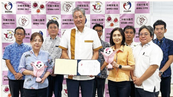
▲(株)りゅうせき建設様を囲んで

沖縄労働局は社員が子育てしやすい環境整備に取り組む「くるみん」企業に新に建設業の(株)りゅうせき建設と電気工事業の(株)那覇電工、製造業の琉球セメント(株)の3社を認定しました。