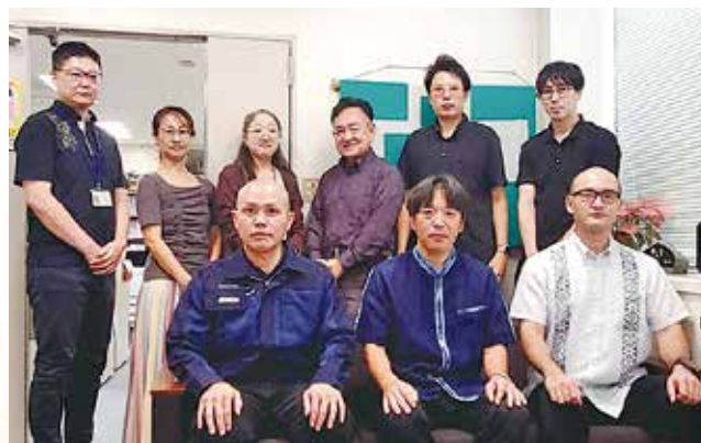
八重山労働基準監督署職員

本年は、特定自主検査及び技能講習の不正防止対策の強化や混在作業場所における元方事業者等への措置