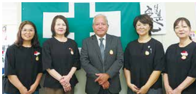
本部・那覇支部職員

業員の健康を経営課題として捉える「健康経営」の重要性が一段と高まっております。心身の健康は、労働災害防止のみならず、生産性の向上や職場定着にも大きく寄与するものであり、当支部といたしましても、会員事業場の皆さまが健康経営に取り組みやすい環境づくりを推進してまいります。