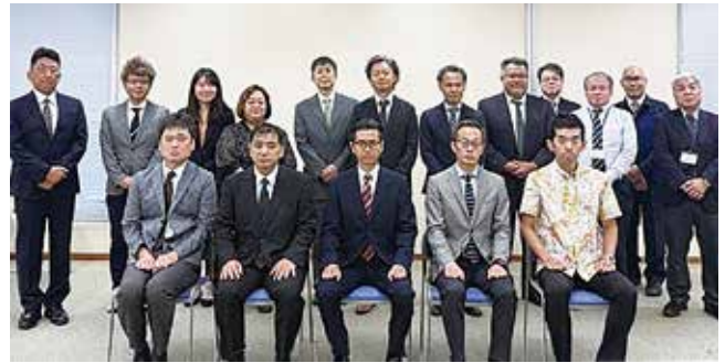
沖繩労働局 幹部職員

明けましておめでとうございます。旧年中は労働行政の運営につきまして、格別の御理解、御協力を賜り、厚く御礼申し上げます。また、貴協会並びに会員の皆様には、日頃より職場環境や労働条件の改善、労働災害の防止等の推進に取り組んでおられることに心から敬意を表します。