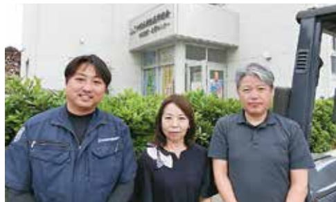
事業部・中部支部職員

特に、転倒、墜落、転落や腰痛といった作業行動に起因する災害が多く、年齢別でみると 50 歳以上の割合が多く