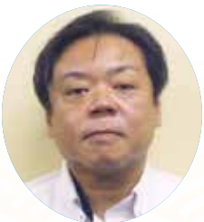
宮古労働基準監督署 署長 瀬底 正亮

新年あけましておめでとうございます。 旧年中は、労働基準行政の運営につきまして、格別のご理解、ご協力を賜り、心からお礼申し上げます。 宮古署管内は観光業が盛んで令和 7 年度上半期の入域観光客数推計値は 665,270 人となり、前年度と比較しますと増減率は 105.8%です。レンタカーの運営者が約 340 件と増加し、ホテルの建設工事等も多数施工され、求人倍率も令和 7 年 9 月時点において 1.86 倍で推移しています。 一方、長時間労働の相談が増加しており、特に月 80 時間を超える時間外・休日労働が発生した労働者への健康障害防止の取組が不十分であることが認められます。貴協会宮古支部長をはじめとする皆様方に対して、健康障害防止等に協力いただくようお願いしておりますが引き続きのご協力をお願いいたします。 また、人手不足等により安全対策が疎かになる懸念があり、フルハーネス等着用するもフック等を親綱等にかけていないまま高所での作業、手すり等の墜落防止措置のない箇所での作業が認められました。優先す