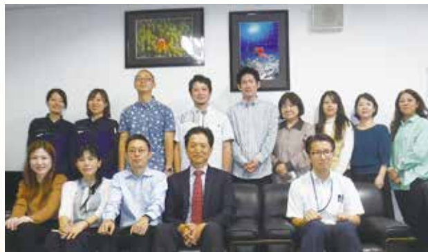
沖縄労働基準監督署職員

「馬には乗ってみよ人には添うてみよ」と言うことわざがあります。何事も経験してみなければ分からないことが多くあると思います。今年は無理せず何かチャレンジしたいと考えています。