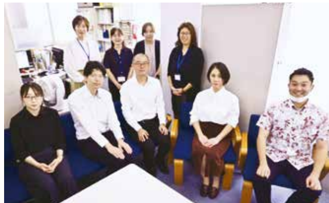
名護労働基準監督署職員

労働災害の状況に目を向けますと、令和 5 年の名護署管内における休業 4 日以上の死傷者数は過去最多を記録し、昨年も 10 月末速報値で依然として高い水準にあります。業種別では建設業が増加傾向にある一方、その他の業種は概ね横ばいで推移しています。労働災害を減少へと転じさせるためには、あらゆる業種が一体となり、安全確保への取り組みを一層強化していくことが求