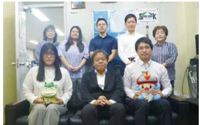
宮古労働基準監督署職員

新年あけましておめでとうございます。 旧年中は、労働基準行政の運営につきまして、格別のご理解、ご協力を賜り、心からお礼申し上げます。 宮古署管内は観光業が盛んで令和 7 年度上半期の入域観光客数推計値は 665,270 人となり、前年度と比較しますと増減率は 105.8%です。レンタカーの運営者が約 340 件と増加し、ホテルの建設工事等も多数施工され、求人倍率も令和 7 年 9 月時点において 1.86 倍で推移しています。 一方、長時間労働の相談が増加しており、特に月 80 時間を超える時間外・休日労働が発生した労働者への健康障害防止の取組が不十分であることが認められます。貴協会宮古支部長をはじめとする皆様方に対して、健康障害防止等に協力いただくようお願いしておりますが引き続きのご協力をお願いいたします。 また、人手不足等により安全対策が疎かになる懸念があり、フルハーネス等着用するもフック等を親綱等にかけていないまま高所での作業、手すり等の墜落防止措置のない箇所での作業が認められました。優先す