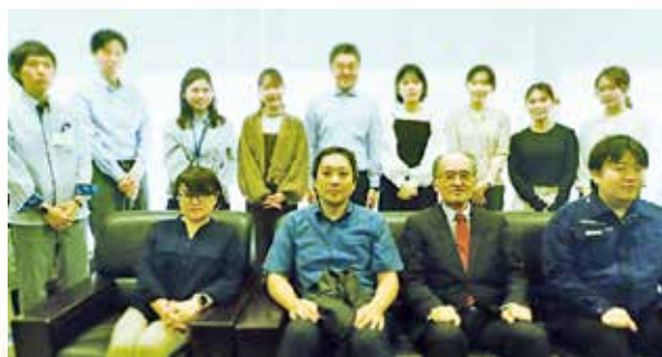
那覇労働基準監督署職員

法が順次施行されます。改正法では、例えば、既存の労働災害防止対策に個人事業者等(中小企業事業主又は役員含む)も取り込み、労働者のみならず個人事業主等による災害防止を図るための措置等が設けられます。また、ストレスチェックについて、努力義務となっている50人未満の事業場につきましても、ストレスチェックや高ストレス者への面接指導の実施が義務付けられます。今後当署におきましても、各種説明会等の場で周知を進めてまいります。会員各社の皆様におかれましても適切な対応をお願い申し上げます。