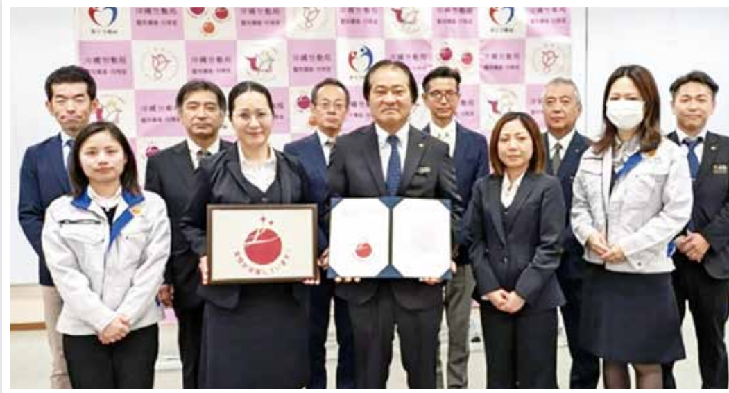
▲「えるぼし」認定された株式会社太名嘉組の皆様と沖縄労働局幹部

沖縄労働局は職場における女性の活躍を推進するための取り組み状況が優良であった株式会社太名嘉組について、令和7年10月に「えるぼし認定 二ツ星」を行い、令和7年12月24日に交付式が行われました。県内での「えるぼし」認定は35社目です。女性従業員が少ない建設業で、いち早く女性活躍推進に取り組んできました。