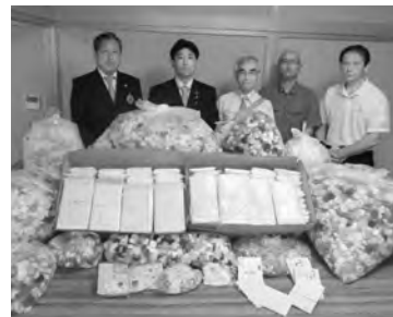
▲笠懸ライオンズクラブ様