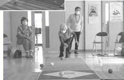
2月14日 笠懸町第5区公民館にて