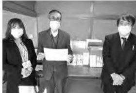
▲第一生命労働組合 太田営業職支部様