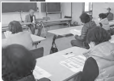
2月8日 笠懸町第4区公民館にて