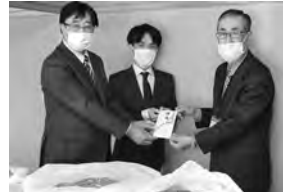
▲ボートレース桐生様