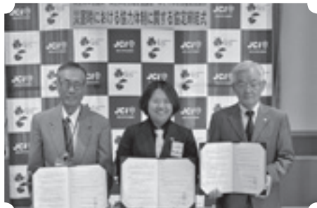
▲ 災害時相互協力協定

9月11日（木）に桐生倶楽部会館にて“災害時における相互協力に関する協定”を締結しました。これは、災害発生時に桐生市社協と本会が設置・運営する災害ボランティアセンターに対し、桐生青年会議所が平時から連携し、円滑な支援体制づくりを目的とした協定です。