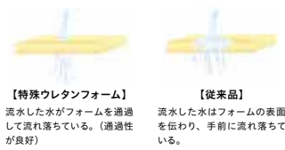
【特殊ウレタンフォーム】 流水した水がフォームを通過して流れ落ちている。(通過性が良好)

通気性に優れた素材で、ムレの不安を解消します。また、クッションの適度な硬さを損わないので、スムーズな体位変換を行うことができます。洗濯・乾燥機の使用もできるため、衛生的にご利用いただけます。