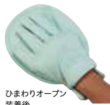
ひまわりオープン 装着後