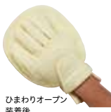
ひまわりオープン 装着後