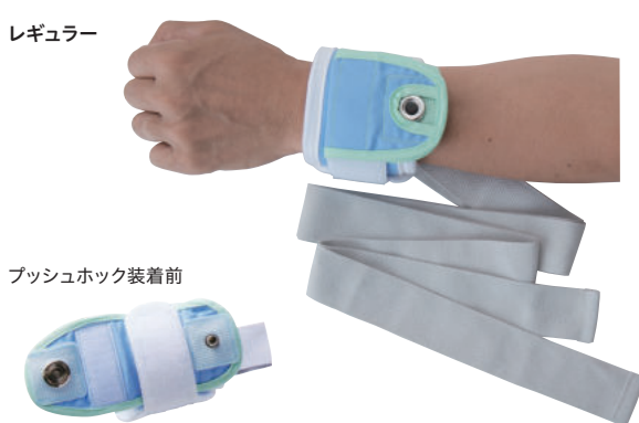
プッシュホック装着前