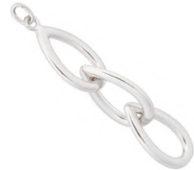
★ 601B エクラII (エンドパーツ)