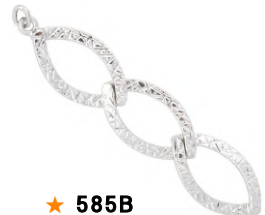
★ 585B エクラ (エンドパーツ)