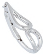
★ 601 エクラII (本体) 8~9mm用