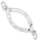
★ 585P エクラ (デザインパーツ)