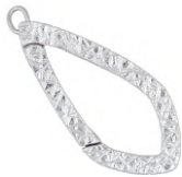
★ 585 エクラ (本体)