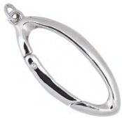
★ 575 エクラ (本体)