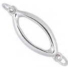
★ 575P エクラ (デザインパーツ)