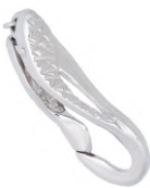
★ 633 エクラIII (デザインパーツ) 6~7mm用