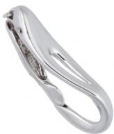
★ 628 エクラIII (本体) 7~9mm用