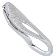
★ 629 エクラIII (本体) 7~9mm用