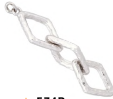
★ 574B エクラ (エンドパーツ)