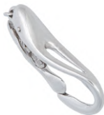
★ 632 エクラIII (デザインパーツ) 6~7mm用