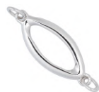
★ 575P エクラ (デザインパーツ)