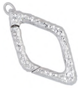
★ 574 エクラ (本体)