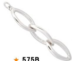
★ 575B エクラ (エンドパーツ)