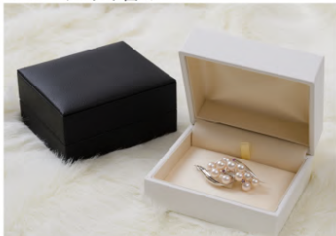
ブローチ/タイ留め

GR86TB 107×92×50mm ¥1,560 ★10個ロット 1個 ¥1,415