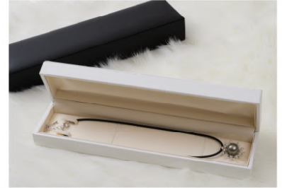
チェーン/ブレス 兼用

GR85NBL 250×65×38mm ¥1,775 ★10個ロット 1個 ¥1,610