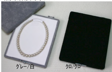
無穴珠用ネックレス

N7000 クレー/白 200×255×40mm ¥10,500 N7000 クロ/クロ 200×255×40mm ¥10,800