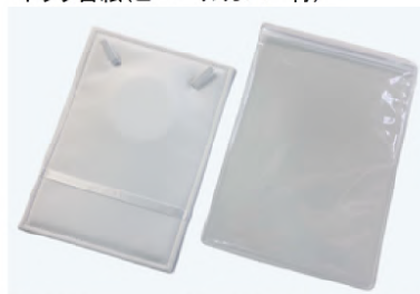
ネック台紙(ビニールカバー付)

BCN293S 165×225mm ¥440 /1セット ★100セット ロット 1セット ¥415