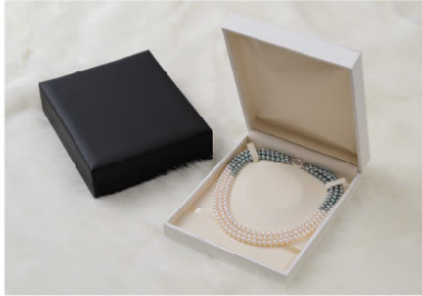
オメガ型ネックレス

GR877N 164×202×50mm ¥2,850 ★5個ロット 1個 ¥2,590