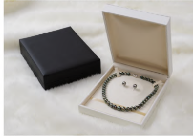
オメガ型ネックレス・イヤリングセット

GR877NE 164×202×50mm ¥2,885 ★5個ロット 1個 ¥2,620