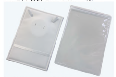
NEセット台紙(ビニールカバー付)

BCNE293S 165×225mm ¥470 /1セット ★100セット ロット 1セット ¥445