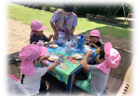
プレ保育クラスの様子

本園に3年保育または満3歳で入園の方に、前年の5月からご利用いただけるプレ保育です。費用・詳細につきましては13ページ「にじ組入会案内」をご覧ください。