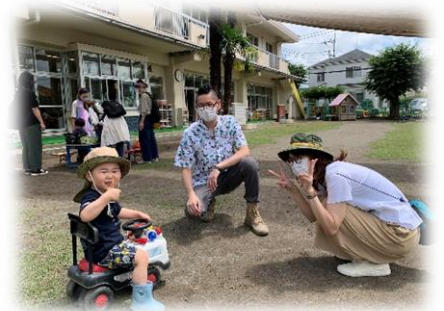
なかよし学級の様子

満1歳から就園前のお子さまとその保護者様を対象とし、子育て情報の交換を行ったり、保護者様どうしの交流の場を作ることを目的として月2回行っています。費用は無料です。日程・詳細は14ページ「なかよし学級へのお誘い」をご覧ください。