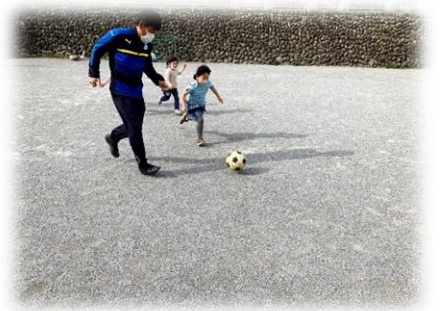
サッカー教室の様子

本園年長児を対象に、外部講師によるサッカー指導を行っています。別途料金にて、降園後に第2園庭を利用したサッカー教室も利用できます。上記教室は、年少クラスから小学校4年生まで利用できます。詳しくは、別紙の案内をご覧ください。