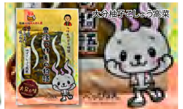
大分柚子しょう高菜