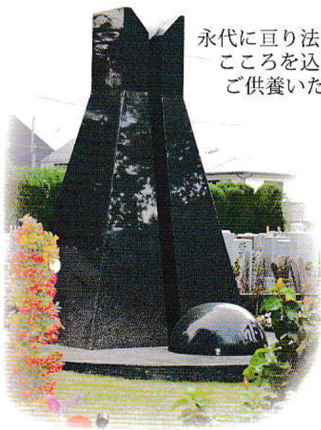
桜花浄苑「祈りの塔」

※ 特定多数の方々と一緒に納められるため、その後改葬（他の場所への移動等）することは出来ません。